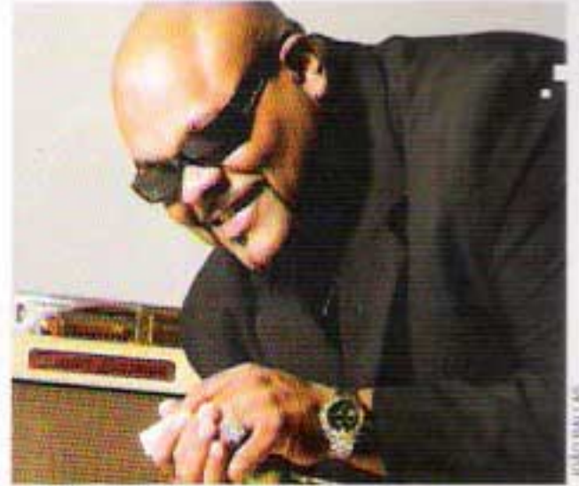
Big Chico: entrevista de cinco páginas na Bélgica

O guitarrista está fazendo sua segunda turnê canadense neste ano, percorrendo sete cidades. Em abril, no mesmo país, ele abriu um show de Johnny Winter.